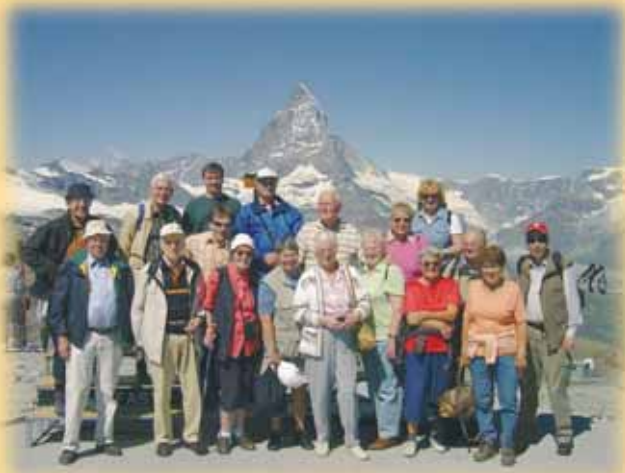
Unsere diesjährige dabei -Reisegruppe am Matterhorn in der Schweiz.